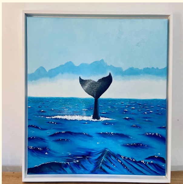
Studente al terzo mese. Pittura ad olio idrosolubile su tela 30×40 cm.